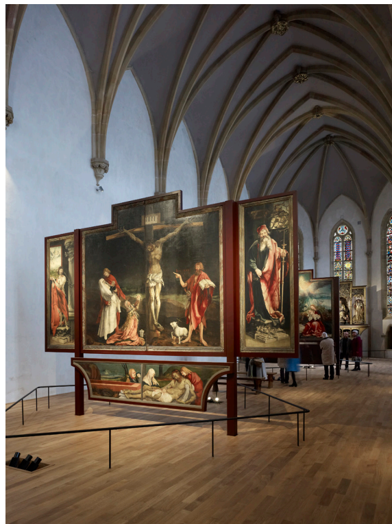
Grünewald et Nicolas de Haguenau, Vue du Retable d'Issenheim, 1512-1516, Musée Unterlinden, Colmar

Die ehemalige Kapelle hat ihre majestätische Raumwirkung bewahrt, die Bodenplatten aus Buntsandstein und die Fliesen aus dem 20. Jahrhundert wurden jedoch durch Eichendielen ersetzt. Sie lenken den Blick des Besuchers zum Retabel, dessen Konstruktion den gesamten Chor einnimmt. Die metallene Tragkonstruktion der Tafelbilder wurde überarbeitet, sodass man die Werke ungestört betrachten kann und dennoch im Falle einer drohenden Gefahr ein schneller Transport möglich ist. Auch die Beleuchtung wurde erneuert und ermöglicht nun eine ausgewogene Verteilung des Lichts: Zu den seitlich angeordneten Lichtquellen sind weitere Spots am Boden hinzugekommen, die den Altar mittig anstrahlen.