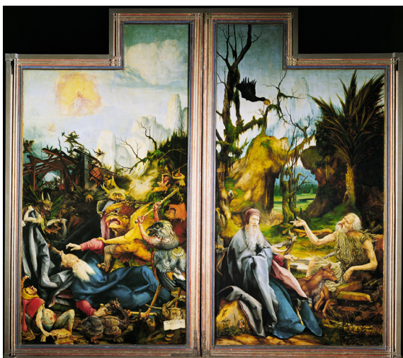
Grünewald, Retable d'Issenheim, Agression de saint Antoine par les démons, 1512 - 1516, technique mixte (tempera et huile) sur panneaux de tilleul, Musée Unterlinden, Colmar

Die erste Restaurierungsphase startet 2018 und betrifft die Skulpturen, die dekorativen Elemente (Baldachin und Rankenornament), die konstruktiven Teile und den neuzeitlichen Altarkasten. Die Arbeiten werden im Rahmen des Möglichen erfolgen und zum Teil öffentlich und für die Besucher nachvollziehbar im Musée Unterlinden sowie in den Werkstätten des C2RMF in Paris ausgeführt.