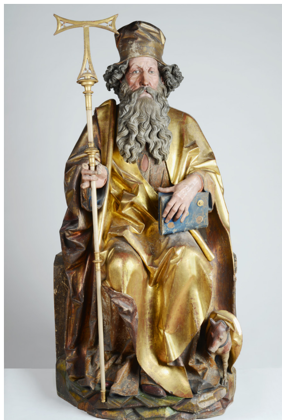
© Musée Unterlinden, Colmar - Nicolas de Haguenau, Saint Antoine , 1512 – 1516, sculptures en ronde-bosse et bas-reliefs en tilleul polychromé, Musée Unterlinden, Colmar

scientifique : mardi 5 mars 2019 pour les sculptures au C2RMF à Paris et mardi 2 avril 2019 pour les panneaux peints à Colmar.